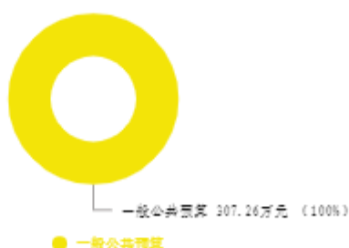
本年收入预算结构图

新乡市文学艺术界联合会本级（本级）2025年收入合计307.26万元，其中：一般公共预算307.26万元；政府性基金预算0万元；国有资本经营预算0万元；财政专户管理资金收入0万元；事业收入0万元；事业单位经营收入0万元；上级补助收入0万元；附属单位上缴收入0万元；其他收入0万元；上年结转结余0万元。