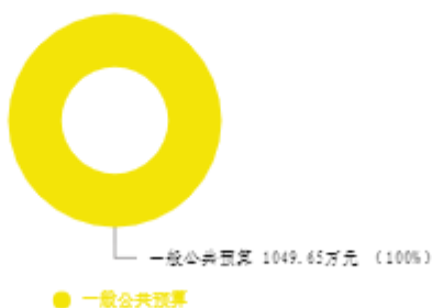
本年收入预算结构图

新乡市教育资源保障中心2025年收入合计1,049.65万元，其中：一般公共预算1,049.65万元；政府性基金预算0万元；国有资本经营预算0万元；财政专户管理资金收入0万元；事业收入0万元；事业单位经营收入0万元；上级补助收入0万元；附属单位上缴收入0万元；其他收入0万元；上年结转结余0万元。