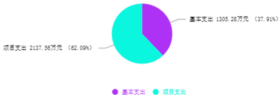
支出预算总体结构图