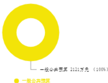
本年收入预算结构图

新乡市第四中学2025年收入合计2,121.00万元，其中：一般公共预算2,109.22万元；政府性基金预算0万元；国有资本经营预算0万元；财政专户管理资金收入0万元；事业收入0万元；事业单位经营收入0万元；上级补助收入0万元；附属单位上缴收入0万元；其他收入0万元；上年结转结余11.78万元。