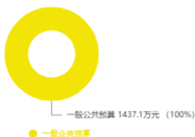
本年收入预算结构图

新乡市第二十中学2025年收入合计1,437.10万元，其中：一般公共预算1,437.10万元；政府性基金预算0万元；国有资本经营预算0万元；财政专户管理资金收入0万元；事业收入0万元；事业单位经营收入0万元；上级补助收入0万元；附属单位上缴收入0万元；其他收入0万元；上年结转结余0万元。