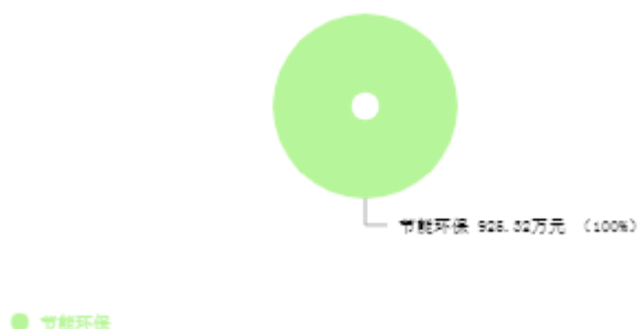
一般公共预算支出结构图

新乡市生态环境局获嘉分局2025年一般公共预算支出年初预算为925.32万元。其中：节能环保（类）支出925.32万元，占100.00%。