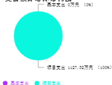
支出预算总体结构图