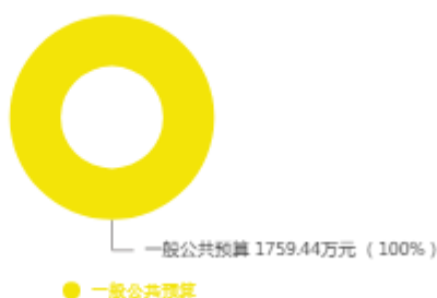
本年收入预算结构图

新乡市运输事业发展中心2025年收入合计1,759.44万元，其中：一般公共预算1,759.44万元；政府性基金预算0万元；国有资本经营预算0万元；财政专户管理资金收入0万元；事业收入0万元；事业单位经营收入0万元；上级补助收入0万元；附属单位上缴收入0万元；其他收入0万元；上年结转结余0万元。