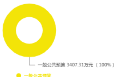
本年收入预算结构图

新乡市交通运输综合行政执法支队2025年收入合计3,407.31万元，其中：一般公共预算3,359.06万元；政府性基金预算0万元；国有资本经营预算0万元；财政专户管理资金收入0万元；事业收入0万元；事业单位经营收入0万元；上级补助收入0万元；附属单位上缴收入0万元；其他收入0万元；上年结转结余48.25万元。