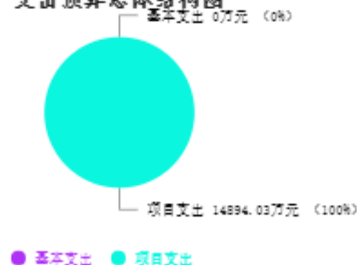
支出预算总体结构图