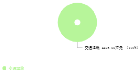
一般公共预算支出结构图

新乡市公路事业发展中心2025年一般公共预算支出年初预算为4,426.22万元。其中：交通运输（类）支出4,426.22万元，占100.00%。