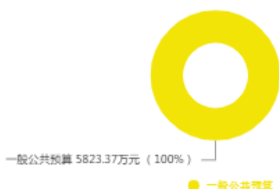
本年收入预算结构图

新乡市文化广电和旅游局2025年收入合计5,823.37万元，其中：一般公共预算5,337.46万元；政府性基金预算0万元；国有资本经营预算0万元；财政专户管理资金收入0万元；事业收入0万元；事业单位经营收入0万元；上级补助收入0万元；附属单位上缴收入0万元；其他收入0万元；上年结转结余485.91万元。