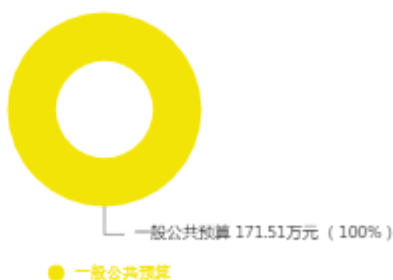
本年收入预算结构图

新乡市社会科学联合会2025年收入合计171.51万元，其中：一般公共预算171.51万元；政府性基金预算0万元；国有资本经营预算0万元；财政专户管理资金收入0万元；事业收入0万元；事业单位经营收入0万元；上级补助收入0万元；附属单位上缴收入0万元；其他收入0万元；上年结转结余0万元。