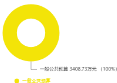
本年收入预算结构图

新乡广播电视台2025年收入合计3,408.73万元，其中：一般公共预算3,202.72万元；政府性基金预算0万元；国有资本经营预算0万元；财政专户管理资金收入0万元；事业收入0万元；事业单位经营收入0万元；上级补助收入0万元；附属单位上缴收入0万元；其他收入0万元；上年结转结余206.01万元。