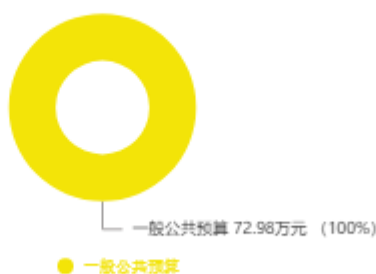
本年收入预算结构图

中国农工民主党新乡市委员会2025年收入合计72.98万元，其中：一般公共预算72.98万元；政府性基金预算0万元；国有资本经营预算0万元；财政专户管理资金收入0万元；事业收入0万元；事业单位经营收入0万元；上级补助收入0万元；附属单位上缴收入0万元；其他收入0万元；上年结转结余0万元。