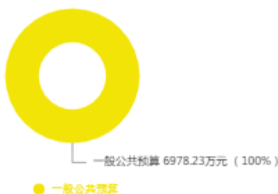
本年收入预算结构图

新乡市机关事务中心（本级）2025年收入合计6,978.23万元，其中：一般公共预算6,812.12万元；政府性基金预算0万元；国有资本经营预算0万元；财政专户管理资金收入0万元；事业收入0万元；事业单位经营收入0万元；上级补助收入0万元；附属单位上缴收入0万元；其他收入0万元；上年结转结余166.11万元。