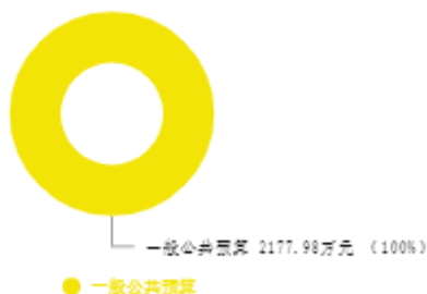
本年收入预算结构图

新乡市统计局2025年收入合计2,177.98万元，其中：一般公共预算1,976.70万元；政府性基金预算0万元；国有资本经营预算0万元；财政专户管理资金收入0万元；事业收入0万元；事业单位经营收入0万元；上级补助收入0万元；附属单位上缴收入0万元；其他收入0万元；上年结转结余201.28万元。