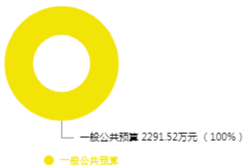
本年收入预算结构图

新乡市司法局（本级）2025年收入合计2,291.52万元，其中：一般公共预算2,240.10万元；政府性基金预算0万元；国有资本经营预算0万元；财政专户管理资金收入0万元；事业收入0万元；事业单位经营收入0万元；上级补助收入0万元；附属单位上缴收入0万元；其他收入0万元；上年结转结余51.42万元。