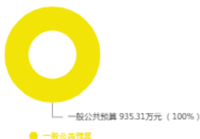
本年收入预算结构图

中共新乡市委党史和地方史志研究室2025年收入合计935.31万元，其中：一般公共预算926.61万元；政府性基金预算0万元；国有资本经营预算0万元；财政专户管理资金收入0万元；事业收入0万元；事业单位经营收入0万元；上级补助收入0万元；附属单位上缴收入0万元；其他收入0万元；上年结转结余8.70万元。