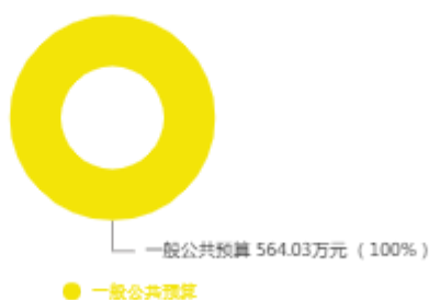
本年收入预算结构图

新乡市动物检疫站2025年收入合计564.03万元，其中：一般公共预算564.03万元；政府性基金预算0万元；国有资本经营预算0万元；财政专户管理资金收入0万元；事业收入0万元；事业单位经营收入0万元；上级补助收入0万元；附属单位上缴收入0万元；其他收入0万元；上年结转结余0万元。