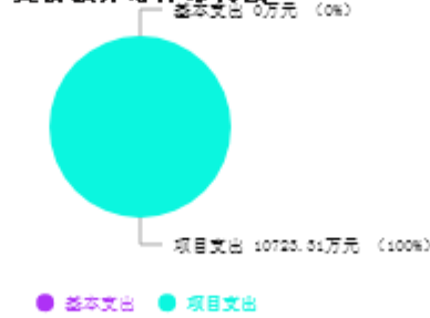
支出预算总体结构图