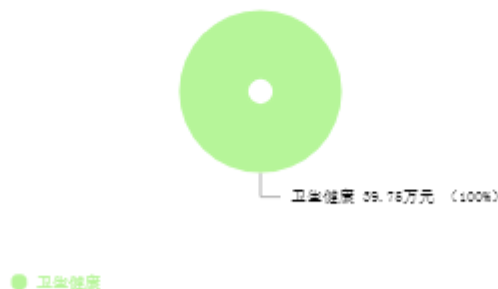
一般公共预算支出结构图

新乡市中医院2025年一般公共预算支出年初预算为39.75万元。其中：卫生健康（类）支出39.75万元，占100.00%。