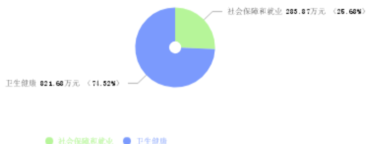
一般公共预算支出结构图

新乡市市直机关医院2025年一般公共预算支出年初预算为1,105.55万元。其中：社会保障和就业（类）支出283.87万元，占25.68%；卫生健康（类）支出821.68万元，占74.32%。