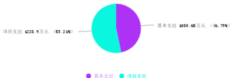
支出预算总体结构图