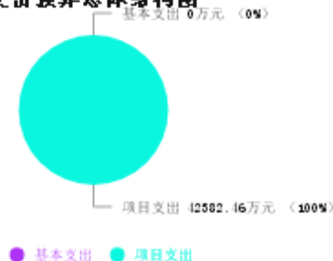
支出预算总体结构图