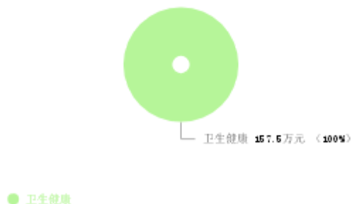
一般公共预算支出结构图

新乡市第二人民医院2025年一般公共预算支出年初预算为157.50万元。其中：卫生健康（类）支出157.50万元，占100.00%。