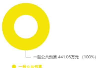
本年收入预算结构图

新乡市烈士陵园2025年收入合计441.06万元，其中：一般公共预算441.06万元；政府性基金预算0万元；国有资本经营预算0万元；财政专户管理资金收入0万元；事业收入0万元；事业单位经营收入0万元；上级补助收入0万元；附属单位上缴收入0万元；其他收入0万元；上年结转结余0万元。