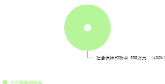
一般公共预算支出结构图

新乡市殡仪馆2025年一般公共预算支出年初预算为698.00万元。其中：社会保障和就业（类）支出698.00万元，占100.00%。