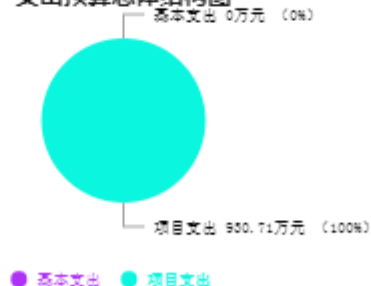
支出预算总体结构图