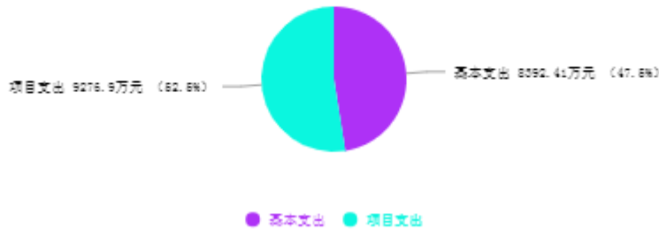
支出预算总体结构图