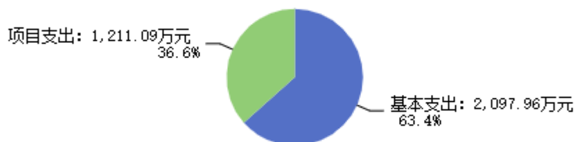
图2：支出决算结构图

2024年度支出合计3,309.05万元，其中：基本支出2,097.96万元，占63.40%；项目支出1,211.09万元，占36.60%。