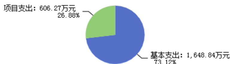
图2：支出决算结构图

2024年度支出合计2,255.11万元，其中：基本支出1,648.84万元，占73.12%；项目支出606.27万元，占26.88%。